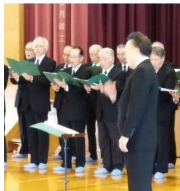
〈楠声会コンサート〉

11月1日から7日は、地域が育む「かごしまの教育」県民週間でした。本校では13日(水)の芸術鑑賞会まで含めて参観をいただきました。多くの方に来校いただきました。ありがとうございました。