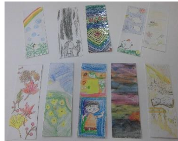
〈しおりコンテスト（児童作品）〉

子供たちには、本に親しむことを通じて、豊かな知識を身に付け、それを主体的に活用し、生涯にわたって幸福や生きがいを感じられる素地を形成していくことを期待します。一方、子供たちの読書量の現状に目を向けると、個人差がとても大きいと感じます。これは、社会全般の大人にも同様のことが言えると思います。